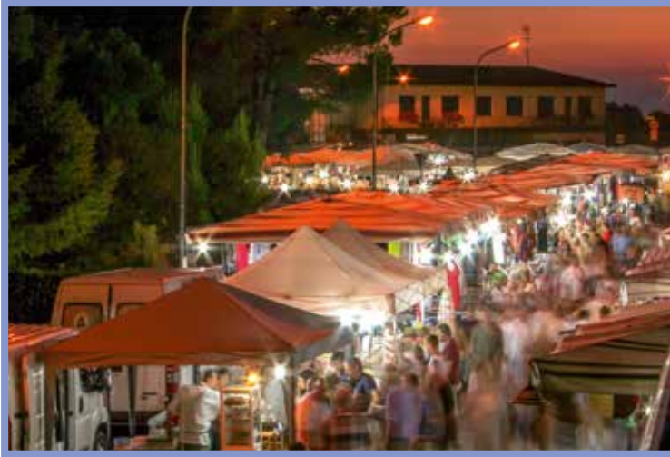
Nachtmarkt in Cavallino

Für viele Urlauber gehört ein Besuch auf einem der zahlreichen Märkte in und um Jesolo und Cavallino zu einem gelungenen Aufenthalt dazu. Sie haben auch jede Menge Gelegenheit dazu, bei den vielen Märkten kommt jeder auf seine Kosten.